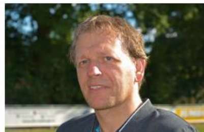
Epco Schierboom Verenigingscheidsrechter